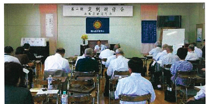
9月26日定例研修会の前に報告会を実施