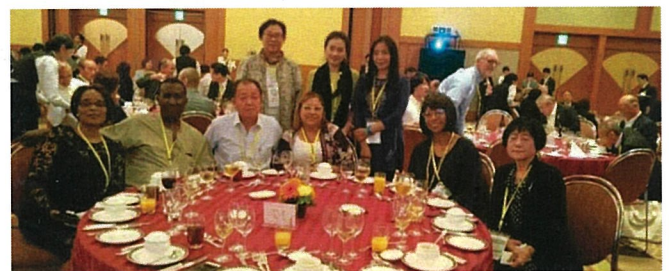
アジア保護司会議終了後の情報交換会

これらの会議は『社会内処遇の発展とコミュニティの役割』及び「国際ネットワークの拡大」を主題とし、世界各国の実務家や研究者等と日本の参加者総計約400名による意見交換と交流の場でした。