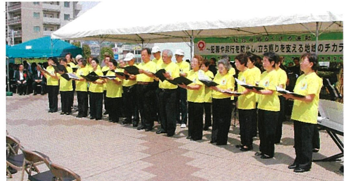
更生保護女性会コーラス部「それいゆ」による合唱