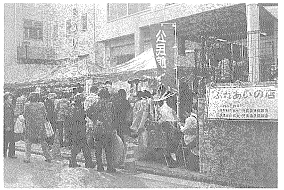
公民館まつり (バザー)