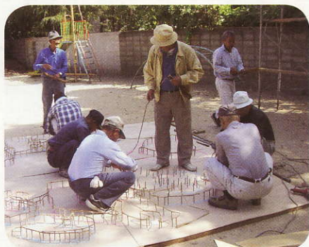
仕掛け花火を作っているところです。

仕掛け花火は、形を考えながら、作っていきます。奉納花火もこれまでの過程を思つと、感慨深いものがありそうです。