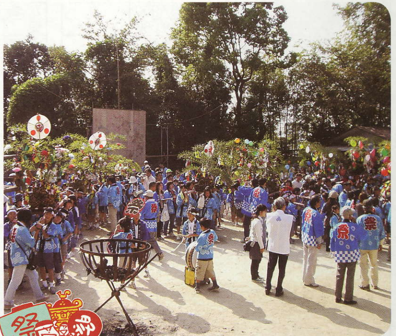
子ども神輿の出発で〜す!

奉納花火ができるまで 10月18日(土)に古江新宮神社で行われる、秋大祭で奉納する花火作りを紹介