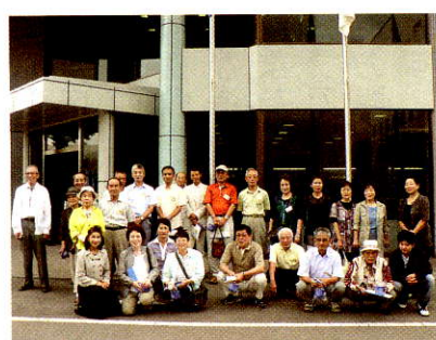
エフピコ見学記念写真