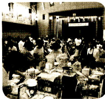
バザー会場は大賑わいです

9月7日(日)11時より古田学区社会福祉協議会主催で、第21回ふれあいひろばが行われました。