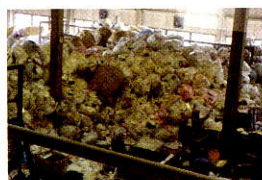
回収された食品トレーの山にビックリ!

エフピコは、食品トレイを作っている会社です。皆さんも食品トレイのリサイクルでスーパーなどに持って行く事があるとありますが、この食品トレイをエフピコでは、もう一度食品トレイなどにします。