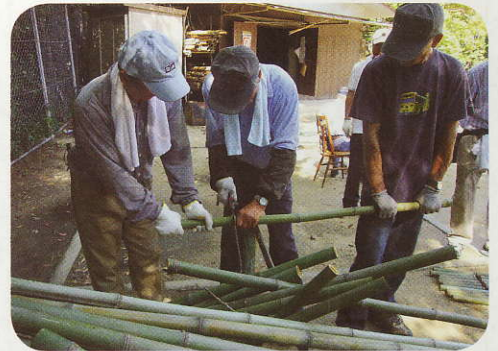
指導を受けながら、竹を切っていきます。

し、かまどを作り、火をおこします。 切ってきた竹は、先輩の厳しい目で選別され(例:若い竹ではだめらしい)、上と下を間違わないように花火に使つ長さに切っていきます。