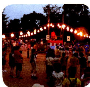
輪になって皆で楽しく踊りましょう。

8月23日(土)、古江新宮神社にて盆踊りが行われました。たくさんの方の屋台も出て賑やかな夏のひと時でした。