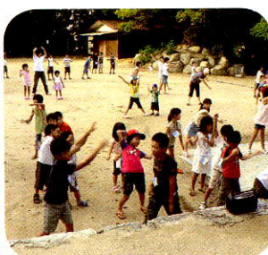
古江東町子ども会のラジオ体操風景