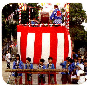
軽快なリズムで竹をたたく子どもたち♪

7月26日(土)、田方第一公園にて盆踊りが行われました。子どもたちが順番に竹をたたき、盆踊りに花を添えていました。抽選会もあり楽しいひと時でした。