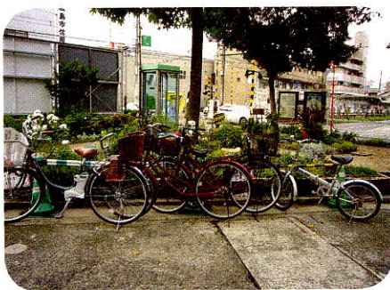
迷惑な駐輪は困ります!!

いつもきれいな花で地域の皆さんの目を楽しませてくれている、広電・古江電停前の「ふれあい花壇」の前に、駐輪禁止場所にもかかわらず自転車・バイクが止めてあります。あまりよい光景ではないと思います。マナーを守って花を楽しんでいただきたいですね。