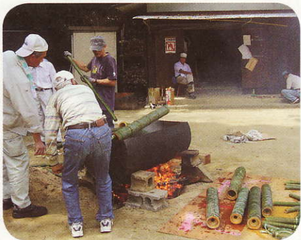
熱湯に気をつけて竹を取り出します。