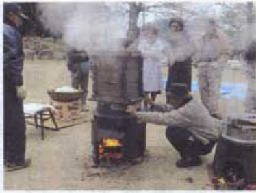
蒸気が逃げないように濡れ新聞紙でふさぎます

古江東町は1月10日(日)、新宮神社で今回、初めて行いました。屋外なので、昔ながらの道具が大活躍しました。「くど(かまど)」や「木製のセイロ」などは、若い世代には珍しいものになりました。