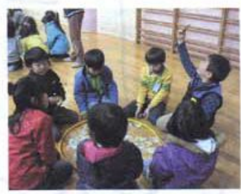
懐かしの犬棒かるたです

大人向けの講習会も、毎月、午前中、児童館で行っています。これまでに皮細工、フラワーアレンジメント、マスコット作り、料理教室などを行いました。現在、母親クラブのメンバーは約80名ですが、まだまだ、メンバー募集中です。