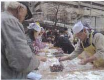
見事な手さばきであんもちが・・・

古江上町は1月31日(日)、古江上二丁目公園で行いました。「くど」を使って蒸し上げたもち米を、石臼で二人が向き合つてテンポよくつきました。おもちがつきあがる度に素早くあんもちや