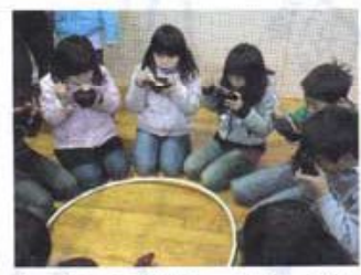
かるたの後は、ぜんざいを食べました

子どもを対象に、紙芝居、パネルシアター、水遊び、クリスマス会、かるた会など、毎月行事があります。特にお菓子作りは人気があり、100人程の子どもたちが参加しました。