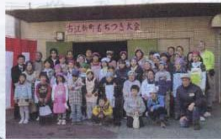
思い出のひとつに