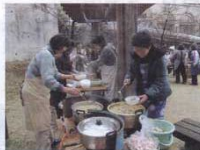
おいしい豚汁はいかが

黄粉もちにされ、並んでいる人たちにふるまわれました。また豚汁も大鍋に4つ用意されましたが、あつという間になくなるほどでした。