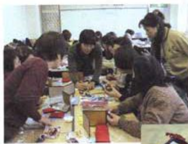
ちよつとした手加減で表情が変わります

2月8日(月)、古田公民館で「はまぐりのおひな様」を作りました。若いお母さんからお年寄りの方まで、定員を超えるお申し込みをいただき、小さな部屋は熱気に包まれ楽しく「おひな様」を作りました。