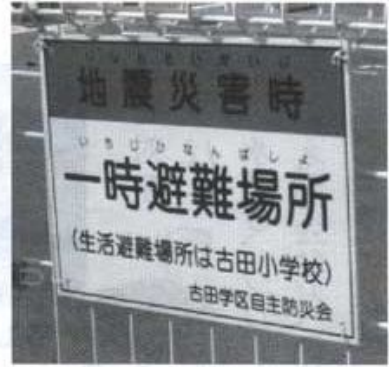
〈一時避難場所の看板〉

古田学区自主防災会では、「地震災害時・一時避難場所」の看板を、各町内数か所に設置しております。今回は、地域の範囲が広いので、縮小・略図地図で設置場所を紹介いたします。気づいている方も多いと思いますが、今一度どこにあるか、確認しておきましょう。 ☆印の箇所にあります。