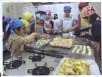
楽しいお菓子作り！

古田児童館を拠点に、地域の子どもたちを見守っています。当初は児童館を利用する子どもの保護者の集まりでした。最近の仕事を持っていく方が多くなったので、若いも若きも時間のある人が子どものいる、いないにかかわらずメンバーになっ